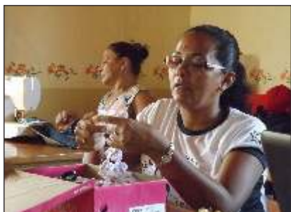
O fuxico é feito apenas com linha, agulha e tiras de tecido.