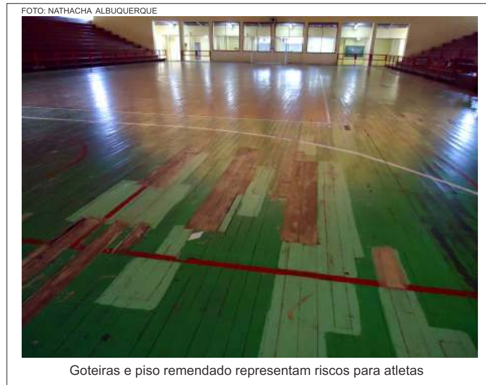
Goteiras e piso remendado representam riscos para atletas