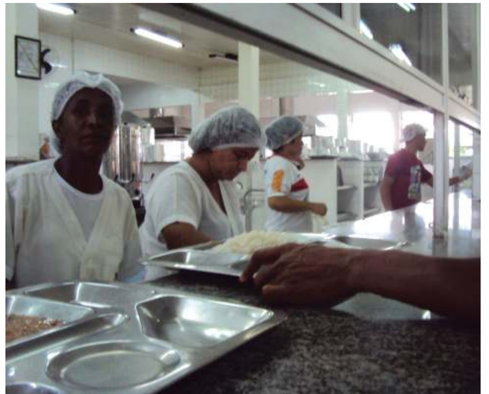
O RU conta com 24 funcionários e funciona de segunda a sexta-feira