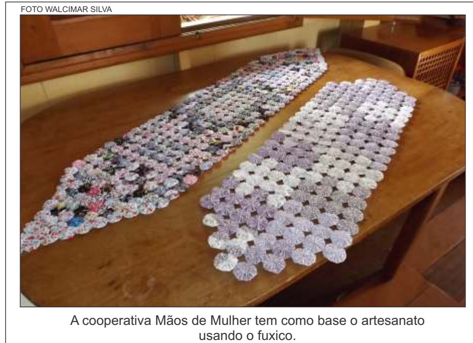
A cooperativa Mãos de Mulher tem como base o artesanato usando o fuxico.