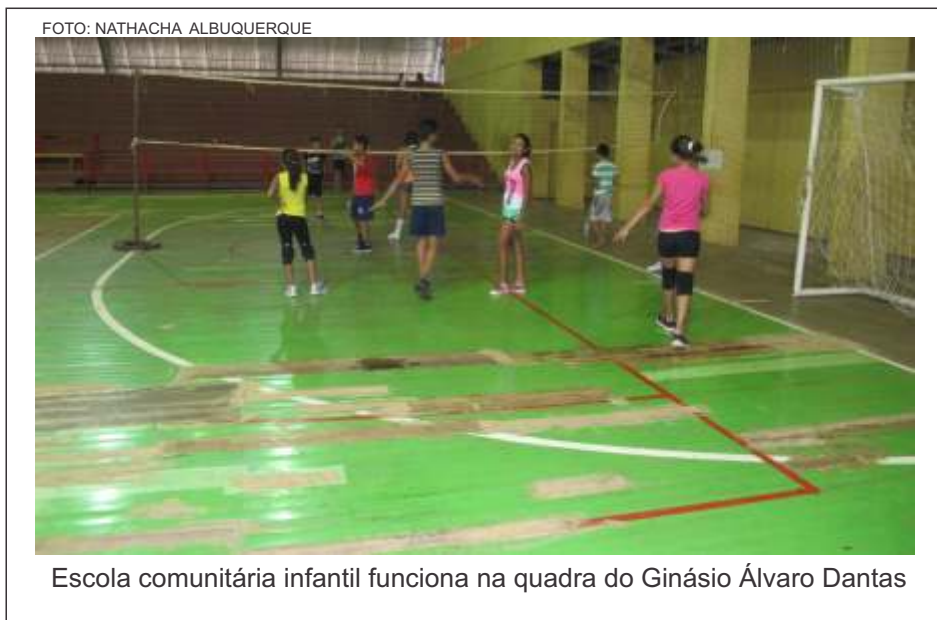
Escola comunitária infantil funciona na quadra do Ginásio Álvaro Dantas