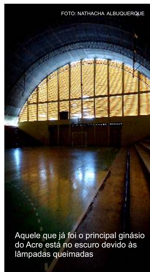
Aquele que já foi o principal ginásio do Acre está no escuro devido às lâmpadas queimadas