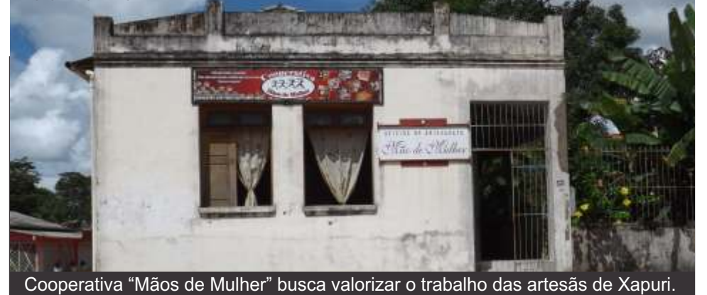
Cooperativa "Mãos de Mulher" busca valorizar o trabalho das artesãs de Xapuri.